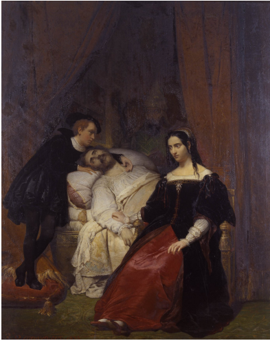
Raymond Auguste Quinsac Monvoisin, Jeanne dit La Loca, ou la folle, reine de Castille , 1833 (Musée de Picardie – Amiens, Francia)