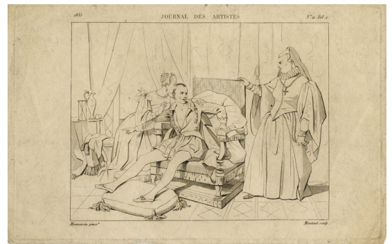
Raymond Auguste Quinsac Monvoisin, La mort de Charles IX , 1835. En