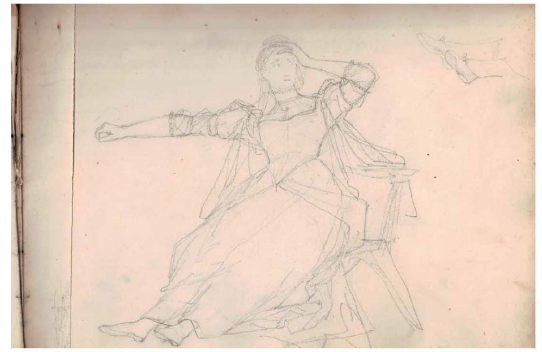
Boceto de Juana la Loca a los pies de Felipe el Hermoso de Austria, su marido moribundo , Carnet Dormal, ca. 1830-1841 (Colección Particular, Buenos Aires, Argentina)