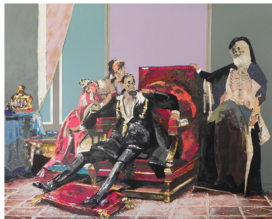
Sebastien Bayer, La mort de Charles IX , 2014 (Colección Particular, Francia)

[1] Explication des ouvrages de peinture et de sculpture de l'École moderne de France, exposes dans le Musée Royal du Luxembourg, destiné aux artistes vivants , París, 1833, n° 1399, p.151.