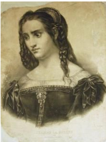
Litografia por Mlle Bès a partir de Raymond Auguste Quinsac Monvoisin, Jeanne La folle (Musée des Beaux Arts et d'Achéologie, Dole, Francia)