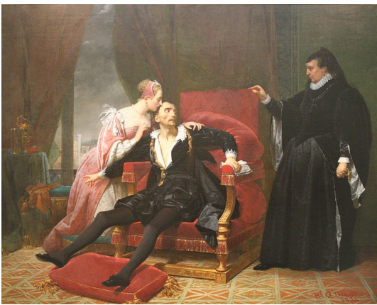
Raymond Auguste Quinsac Monvoisin, La mort de Charles IX Journal des artistes, N°21, Vol. 1, 1835 , 1834 (Musée Fabre, Montpellier Méditerranée Métropole, Francia)