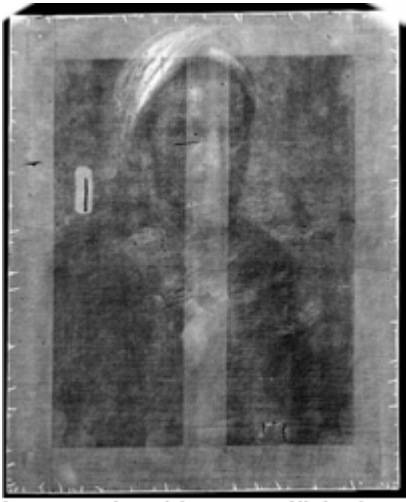
Imagen obtenida por análisis de rayos X donde se aprecia la pintura subyacente. LFD1474. 63_niveles ajustados